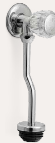
llave para urinario galápagos GR.03.D.000