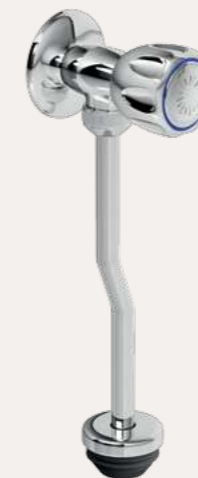
llave para urinario vallarta GR.03.V.000