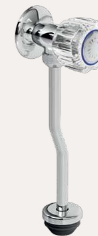
llave para urinario aruba GR.03.A.000