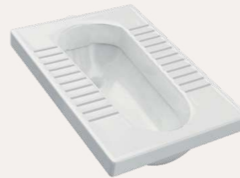
taza turca punta sal