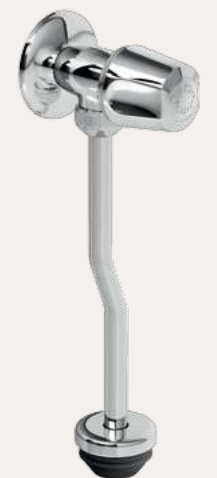
llave para urinario cancún GR.03.C.000