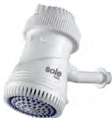
SOLRDE5500N DUCHA ELÉCTRICA SOLE NOVA