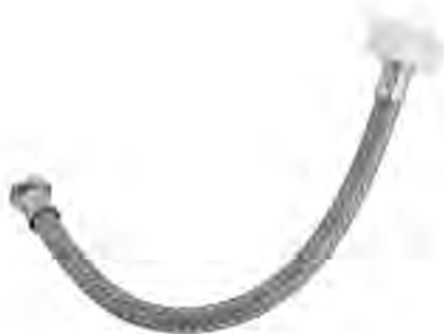
MAST505 1/2"X1/2"PL X35CM H-H