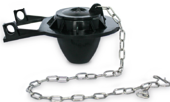
MASE175 FLAPPER CADENA