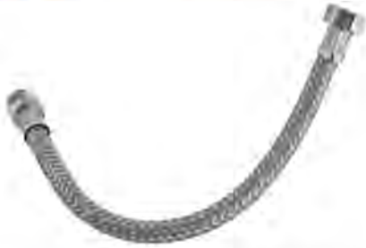
MAST503R* 1/2"X1/2"X40CM M-H * Con recubrimiento de PVC