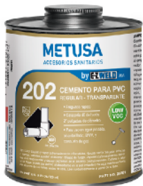
PEG007 DORADO 16 OZ (1/8 GLN)