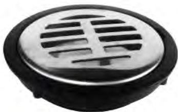
MASG009 2" SUMIDERO BASIC