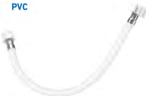
MAST404 1/2"X1/2"X40CM M-H / AGUA FRÍA