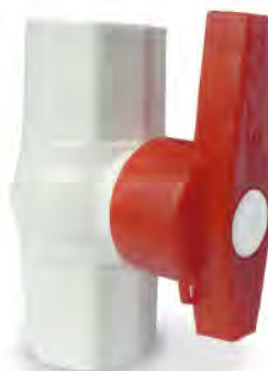
MASC124 DE PVC 3/4"