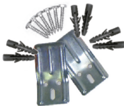
MASC127 SOPORTE PREMIUM PARA LAVATORIO