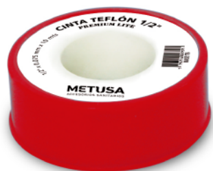
MASE176 1/2 X 10 MTS.