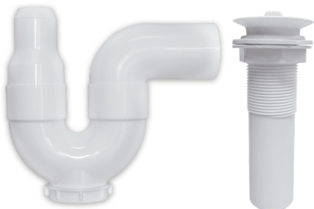
MASAA022B U 2" con adaptador 1 1/4" - 1 1/2" MASAA023B U 2" trampa + desagüe 1 1/2"