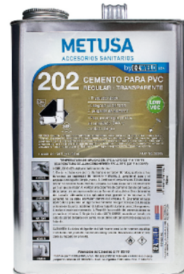
PEG018 (1 GLN)