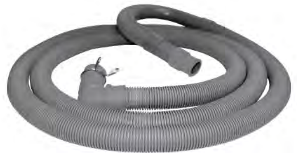
MASE188 MANGUERA PARA LAVADORA DESCARGA 2M