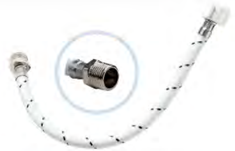
MAST904 1/2"X1/2"X40CM M-H *