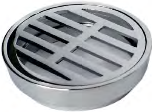
MASG007 4" SUMIDERO PREMIUM