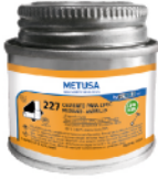
PEG023 NARANJA 2 OZ (1/64 GLN)