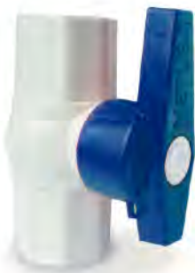
MASC123 DE PVC 1/2"