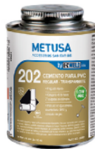
PEG015 DORADO 4 OZ (1/32 GLN)