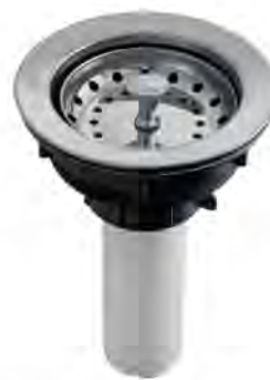
MASB003C 3 1/2" - 4"