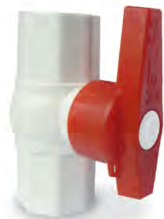
MASC125 DE PVC 1"