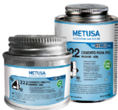
PEG019 CELESTE 2 OZ (1/64 GLN) PEG012 CELESTE 4 OZ (1/32 GLN)