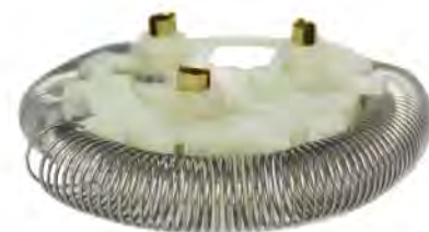
SOLRDER002 RESISTENCIA 5400W