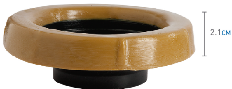
MASE159M ANILLO DE CERA CON GUÍA DE POLIPROPILENO REFORZADO