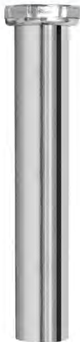
MASB176A 1 1/2"X8" PARA DESAGÜE LAVADERO