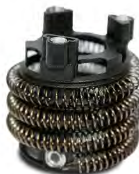
SOLRDER003 RESISTENCIA 5500W