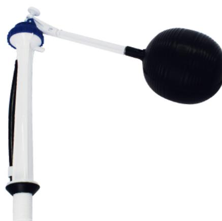
MASE172 VÁLVULA DE INGRESO DE 2 PIEZAS