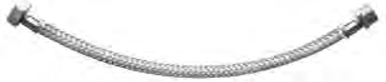
MAST530 1/2"X1/2"X50CM M-H