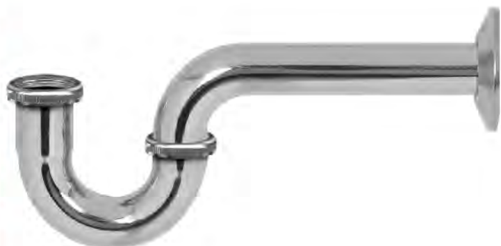
MASA024C 1 1/2" ESTANDAR