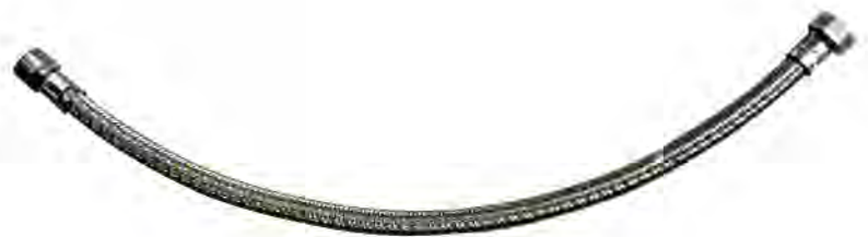
MAST630 1/2"X1/2"X50CM M-H