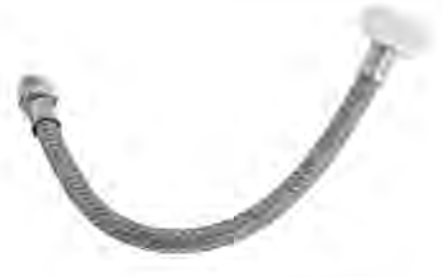
MAST515R* 1/2"X7/8"PL X40CM M-H * Con recubrimiento de PVC