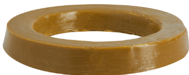
MASE151M ANILLO DE CERA SIN GUÍA