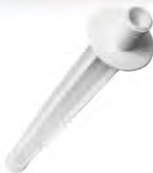
SOLRDER001 BRAZO DE DUCHA