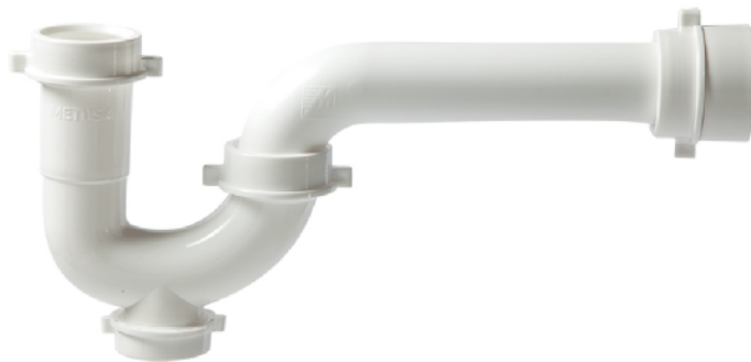
MASAA015C 1 1/4" - 1 1/2" CON REGISTRO