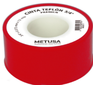
MASE177 3/4 X 12 MTS.