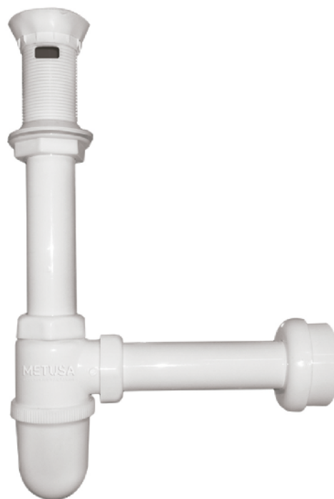
MASAA021B BOTELLA 1 1/4"X10"