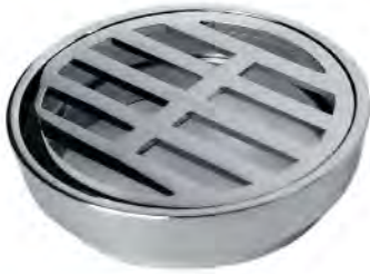
MASG005 2" SUMIDERO PREMIUM