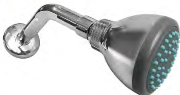
MASE149 CABEZA DE DUCHA