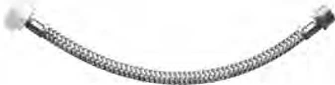
MAST517 1/2"X7/8" PL X35CM H-H