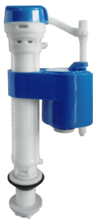
MASE155 VÁLVULA DE INGRESO UNIVERSAL