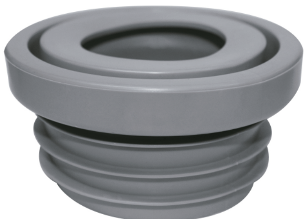
MASE184 ANILLO PVC P/INODORO