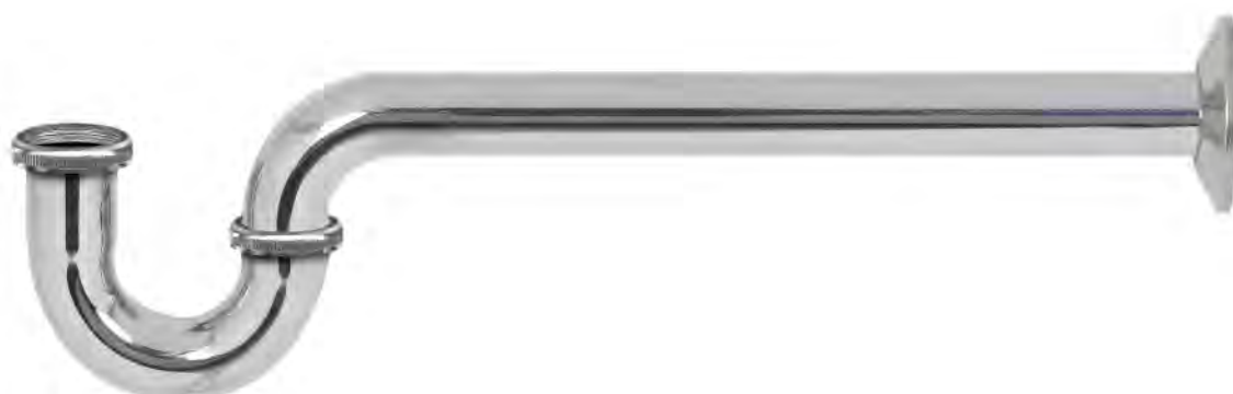
MASA004LC 1 1/4" COLA LARGA