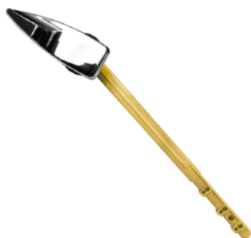
MASE182 PALANCA INODORO