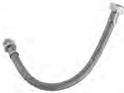
MAST509 1/2"X5/8"X40CM M-H