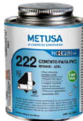
PEG008 CELESTE 8 OZ (1/16 GLN)