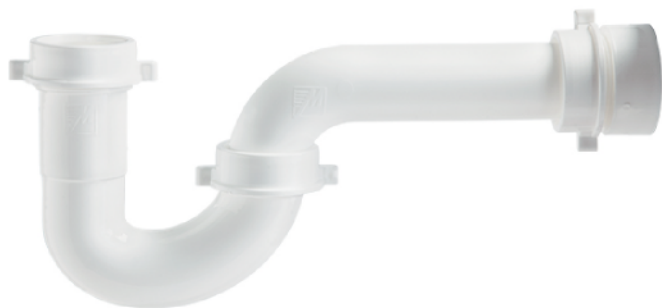
MASAA005B 1 1/4"-1 1/2"