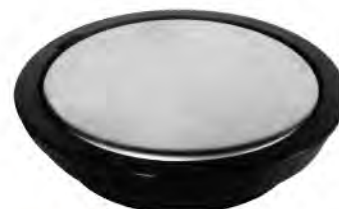
MASG010 2" REGISTRO BASIC