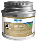
PEG020 DORADO 2 OZ (1/64 GLN)