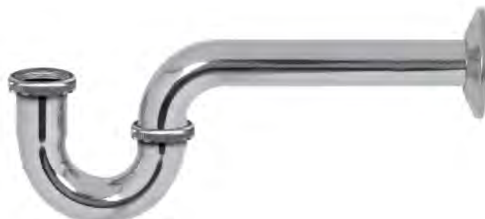
MASA023C 1 1/4" ESTANDAR