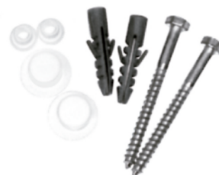
MASE146 JUEGO DE PERNOS DE ANCLAJE