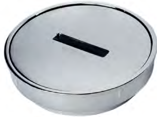
MASG008 4" REGISTRO PREMIUM