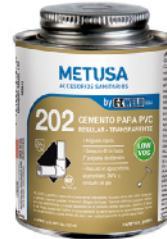
PEG011 DORADO 8 OZ (1/16 GLN)