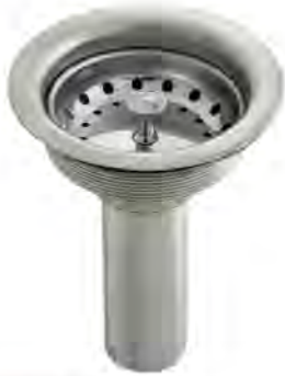
MASB004C 3 1/2" - 4"