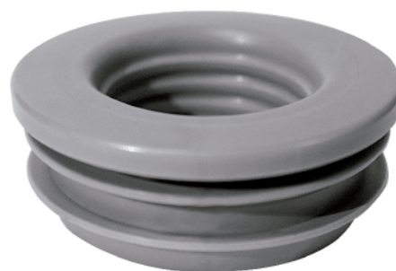
MASE183 CONECTOR SOLUCIÓN 1 ½"