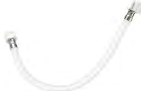
MAST405 1/2"X7/8"X40CM M-H / AGUA FRÍA