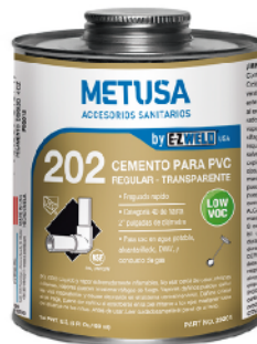
PEG004 DORADO 32 OZ (1/4 GLN)