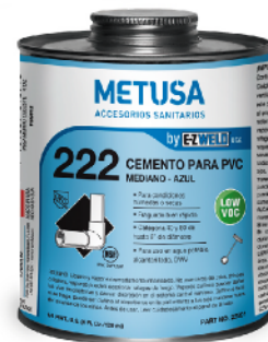
PEG001 CELESTE 32 OZ (1/4 GLN)