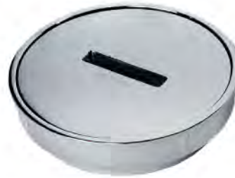
MASG006 2" REGISTRO PREMIUM