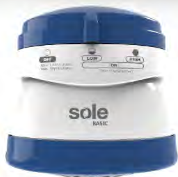
SOLRDE5400A DUCHA ELÉCTRICA SOLE