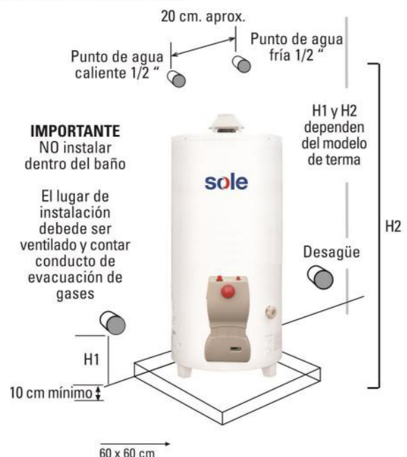
DIAGRAMA DE INSTALACION